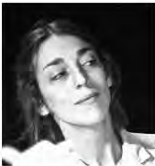
Camille Durand-Tovar Les gouttes de sang sur la neige (2014) La communauté imaginée (2016)