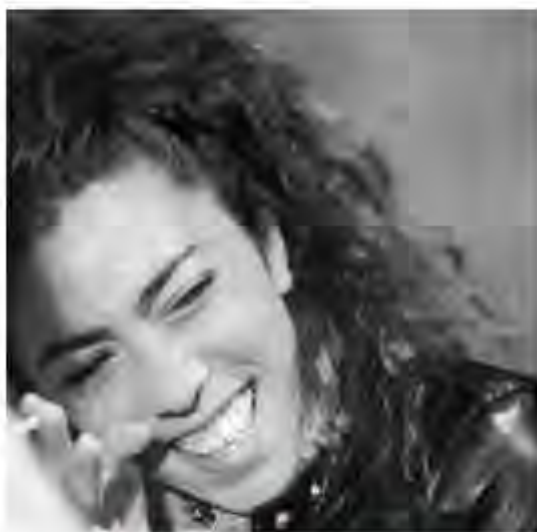
Marie-Magdeleine La Famille vient en mangeant (2012) G.R.A.I.N. (2015)

Toujours sans décor et au public, la forme épurée chère à la compagnie sera menée encore plus loin, chacune amenant ses propres personnages, et jouant avec ceux des deux autres... Bref, un triple tourbillon !